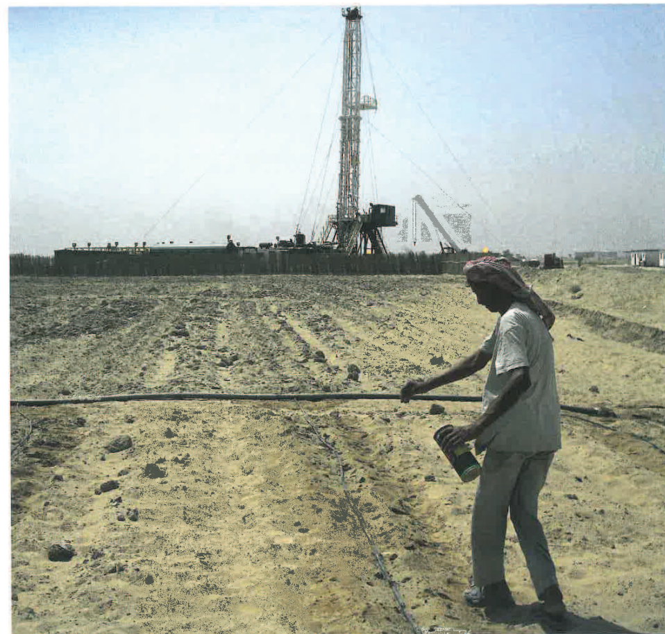
Onderhoud is in het westen geoptimaliseerd. Maar het Midden-Oosten is aan een inhaalslag bezig. ‘Over een jaar of twintig wordt de hoeveelheid werk voor ons snel minder. Dan heeft men de expertise die wij hebben zelf ook.’

Wat betreft de cursisten gaat het met name om het midden- en hoger kader van grote